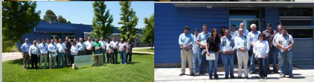
Foto 6. Reunión Proyecto Fondef de jugos funcionales (arriba izquierda). Reunión investigadores Proyecto FIA de recubrimientos anti escaldado (arriba derecha). Staff técnico de Agrozzi (abajo izquierda); productores y staff técnico Dole (abajo derecha).

POMACEAS, Boletín Técnico editado por el Centro de Pomáceas de la Universidad de Talca. De aparición periódica, gratuita.