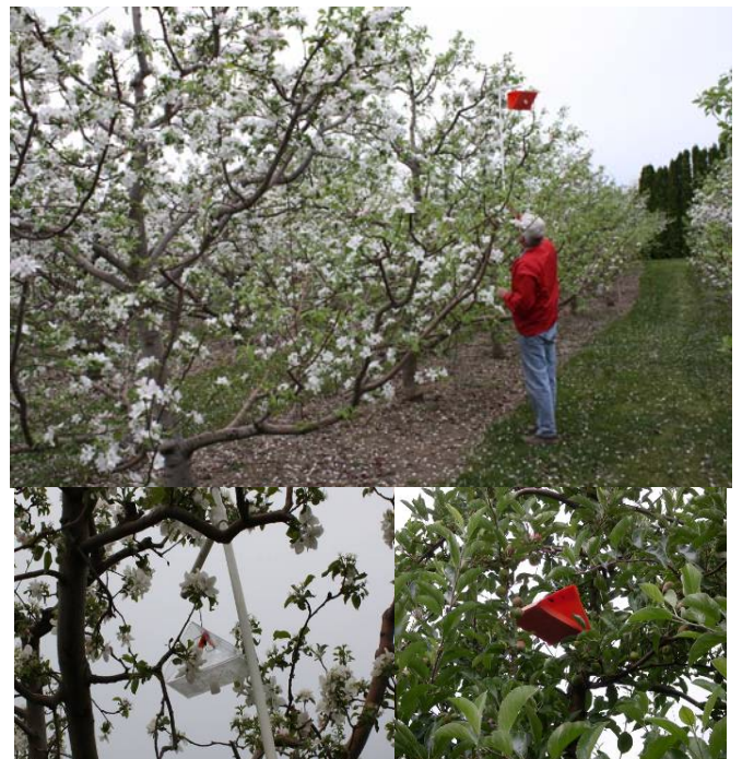
Foto 3. Trampa transparente cebada con kairomonas (éster de pera y ácido acético) para la captura selectiva de hembras de la polilla de la manzana (arriba). Trampa roja cebada con feromona y kairomona (éster de pera), cebo Combo, para incrementar la captura de machos de la polilla de la manzana (abajo).