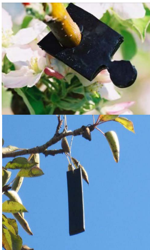
Foto 4. Dispensadores Sidetrack, cargados con feromona sexual y ésteres de pera (arriba). Meso-dispensadores, para superficies de 25-50 ha (abajo).

La Foto 4 muestra dos tipos de dispensadores de feromonas.