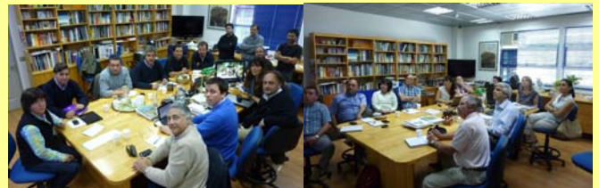
Foto 1. Asistentes a las dos reuniones del Proyecto de Pink Lady™.

Los días 10.10.2012 y 10.01.2013 se sostuvieron en el CP dos reuniones de trabajo con productores de Pink Lady™, Exportadora San Clemente y la Fundación para el Desarrollo Frutícola (FDF), a fin de evaluar los avances del Proyecto de pardeamiento interno de este cultivar y planificar investigaciones futuras ( Foto 1 ).