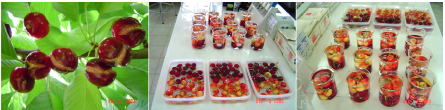
Foto 2. Partidura en cerezas Bing y sumergidas en agua destilada, cosechadas en distintos estados de madurez para determinar su cinética de partidura.