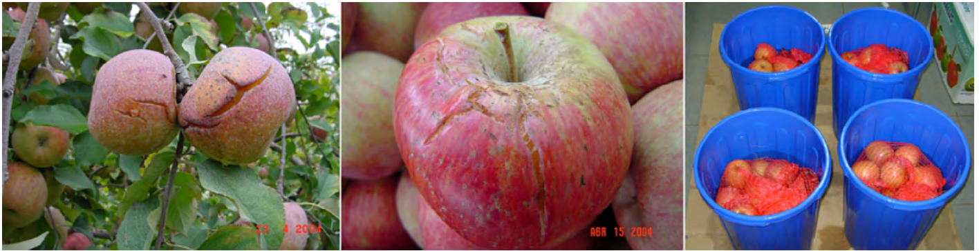
Foto 1. Partidura de manzanas Fuji luego de una lluvia durante el periodo de cosecha y ensayo realizado con fruta sana sumergida por al menos 5 horas, resultando muy baja la partidura de ésta.