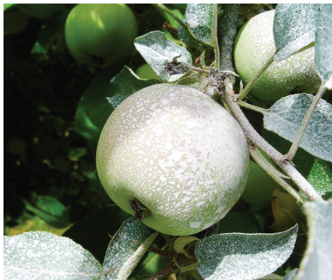
Protector solar en base a caolina aplicado en post cosecha de cerezos y en frutos de manzanos.

Agradecemos el apoyo de la Fundación para la Innovación Agraria (FIA) a través del Proyecto: Indicadores nutricionales y agroclimáticos para la producción de cerezas de alta calidad bajo cubiertas plásticas: una estrategia de adaptación microclimática (PYT-2019-0352).