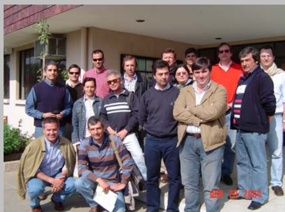
Foto 4. Delegación de productores de fruta de Portugal.

El 29 de Abril un grupo de 15 fruticultores de Portugal visitó el CP, como parte de una gira técnica (Foto 4).