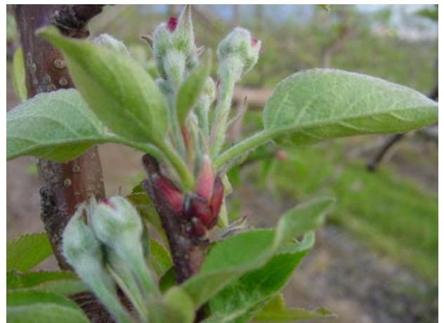
Foto 3. Brotación de una yema floral de manzano, luego de haber alcanzado las horas de frío necesarias.

Lo anteriormente expuesto puede ser demostrado al comprobar que en la práctica, a nivel mundial, las variedades Gala y Elstar de menor calibre, con mayor incidencia de russet pedicelar y la más alta susceptibilidad al bitter pit, son producidas en Brasil. La calidad de la fruta aumentaría en el siguiente orden de países: SudÁfrica, Nueva Zelanda, Chile y finalmente, USA (Estado de Washington). Aún así, en Brasil, en años con mucha acumulación de frío o en zonas especialmente heladas, se puede obtener fruta de calidad.